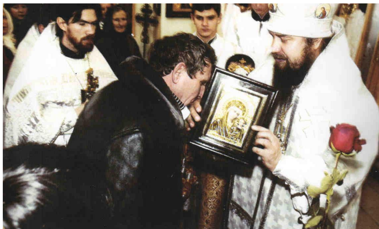
Награждение ктитора храма.