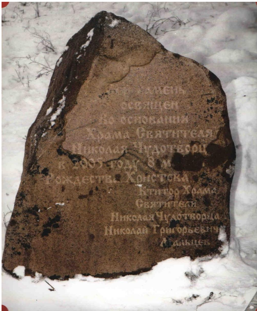
Камень в основании храма.