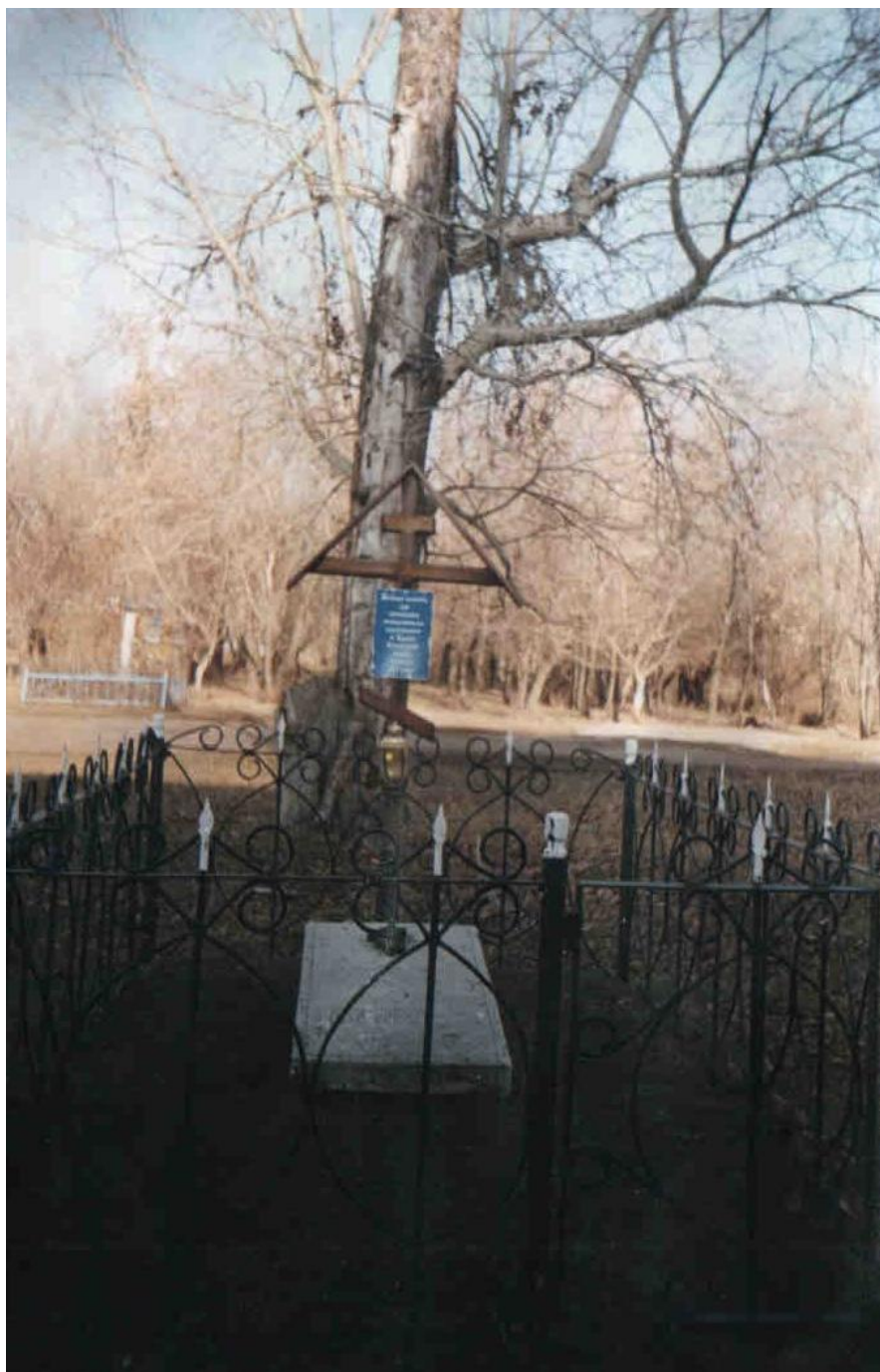
Надгробная плита на месте захоронения священников.