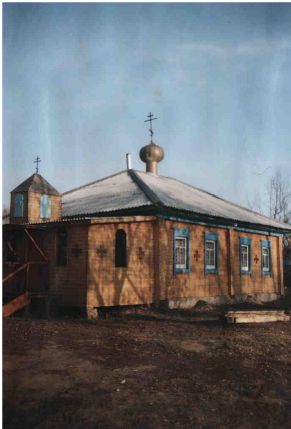
Собор Казанской Божьей Матери. 1996 год.