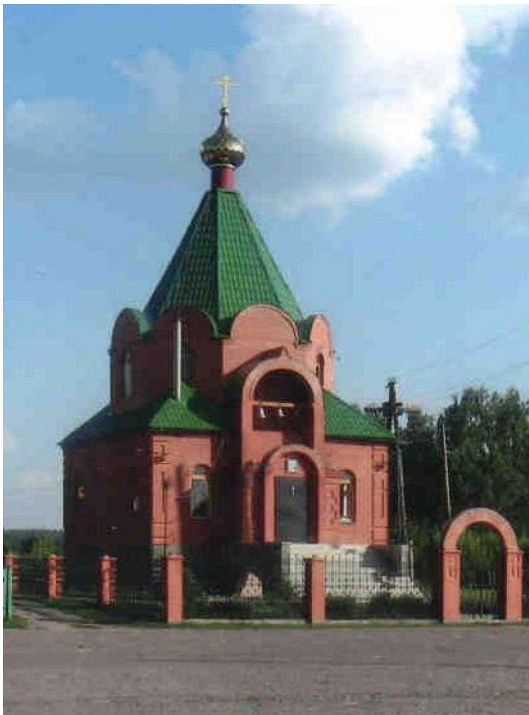
Храм Святого Николая Чудотворца. 2005 год.